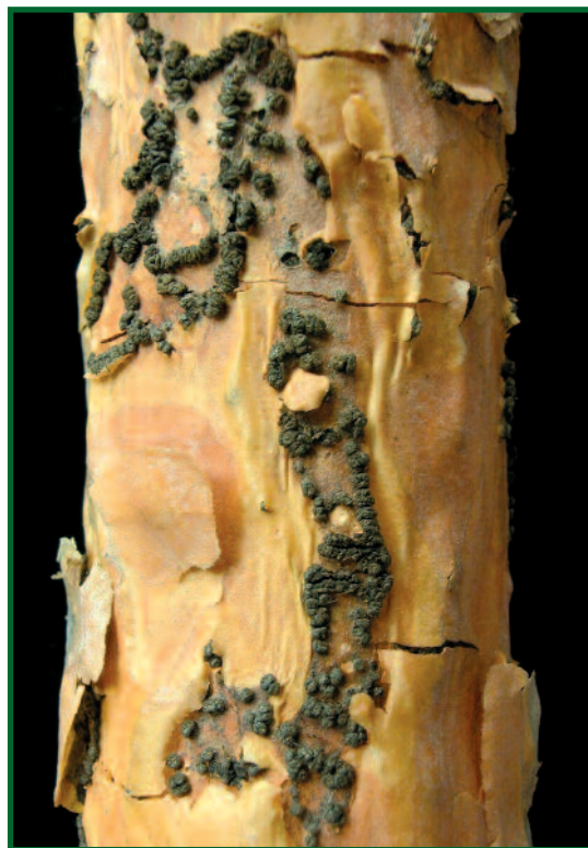
Vřeckaté plodnice C. ferruginosum na větvi borovice.

Sphaeropsis sapinea vytváří výlučně anamorfní plodnice – drobné, kuželovité, černě až černohnědě zbarvené pyknidy s četnými, zpočátku bezbarvými jednobuněčnými, záhy však tmavohnědě zbarvenými, vejčitými až válcovitými, často dvoubuněčnými konidie- mi 25–40 x 10–16 µm velkými.