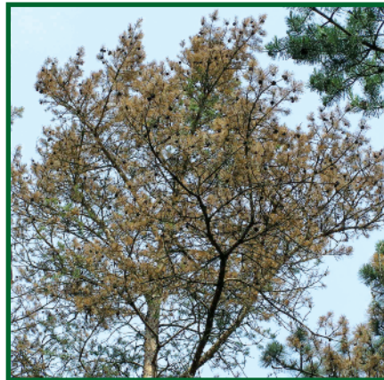
Borovice lesní napadená houbou C. ferruginosum .